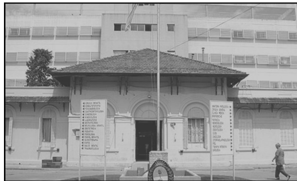
H.I.G.A. “A.F. PIÑEYRO” DE JUNIN

Acompañar y guiar en la formación del Médico Especialista en Clínica Médica, para capacitarlo en el cui- dado integral de pacientes con pro- cesos salud-enfermedad complejos en un marco de rigor científico y compromiso humano.